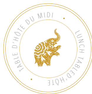
TABLE D'HÔTE LUNCH MENU